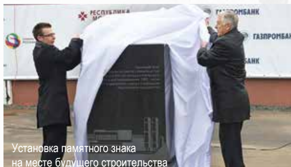
Установка памятного знака на месте будущего строительства

В ходе переговоров были определены пути дальнейшего сотрудничества, а также подведены итоги минувшего года. 2014 год оказался весьма успешным для холдинга, несмотря на непростую экономическую ситуацию в стране и введенные против России санкции. Президент американской компании высоко оценил активность российского Пенетрона в открытии новых заводов по производству гидроизоляционных материалов и увеличении объемов выпуска продукции, освоении новых рынков сбыта.