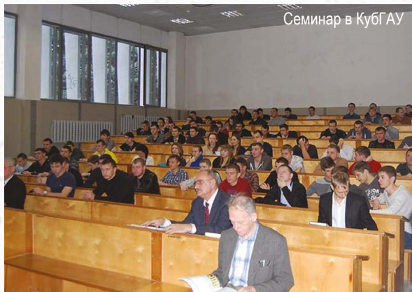
Семинар в КубГАУ