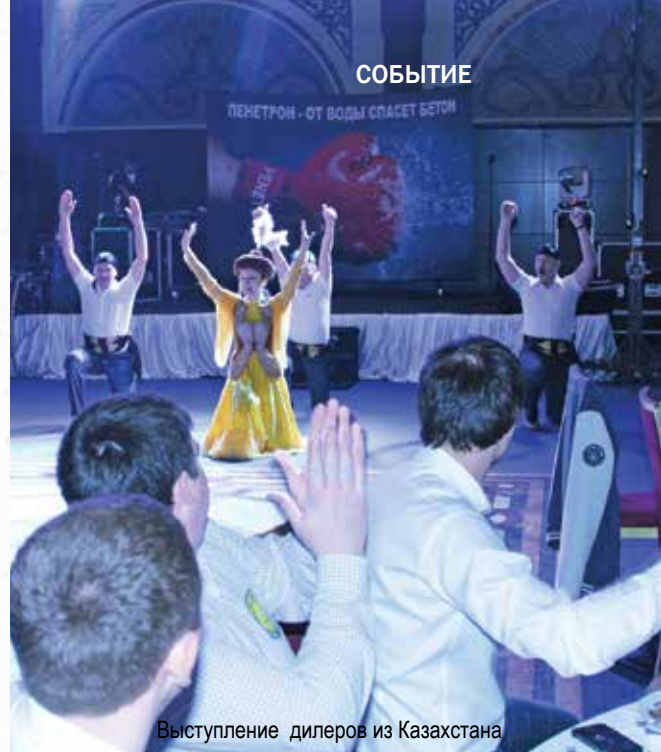
Выступление дилеров из Казахстана