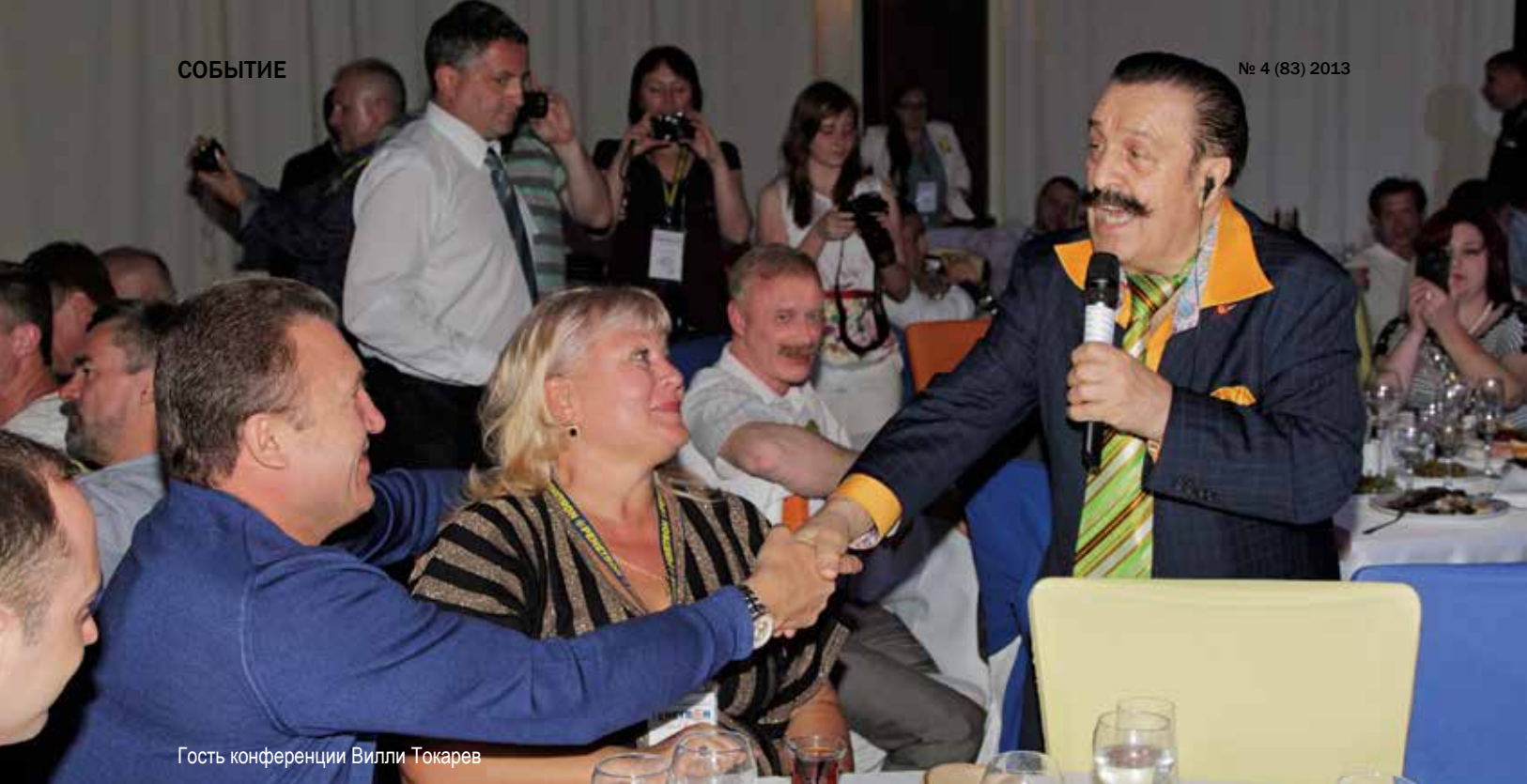
Гость конференции Вилли Токарев

общался с участниками конференции и вместе с ними исполнял немного грустные, но очень душевные песни.