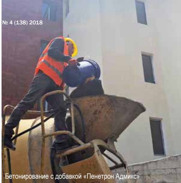
Бетонирование с добавкой «Пенетрон Адмикс»

Невозможно во всей полноте впечатлений рассказать обо всем этом словами. Надо видеть. Но чтобы видеть, здесь надо быть, а желательнее пожить, по меньшей мере, какое-то время. Для того и строит Отель на Мтацминда известная в Грузии многопрофильная компания GDG Group. Архитектурно-планировочное решение в так называемом органичном стиле располагает комплекс зданий как бы «взбирающимся» по склону, гармонично вписывая в рельеф нагорья, «растворяя» в окружающем ландшафте. Строительство на сложном рельефе – весьма сложная задача, требующая, среди прочего, учета устойчивости склона и возможных подвижек почвы под