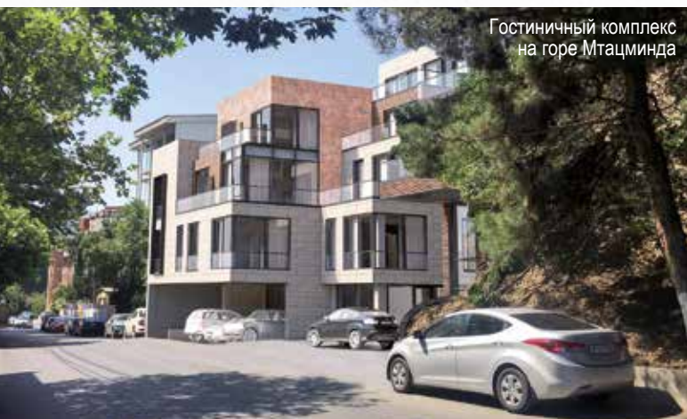
Гостиничный комплекс на горе Мтацминда

Высококласный Отель на горе Мтацминда, который строит в Тбилиси многопрофильная компания GDG Group, по замыслу проектировщиков должен быть органично вписан в окружающий ландшафт Святой горы. Для гидроизоляции подземных и прилегающих к скалам бетонных конструкций гостиничного комплекса применяется добавка в бетон «Пенетрон Адмикс».