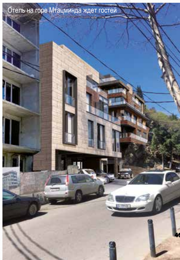
Отель на горе Мтацминда ждет гостей