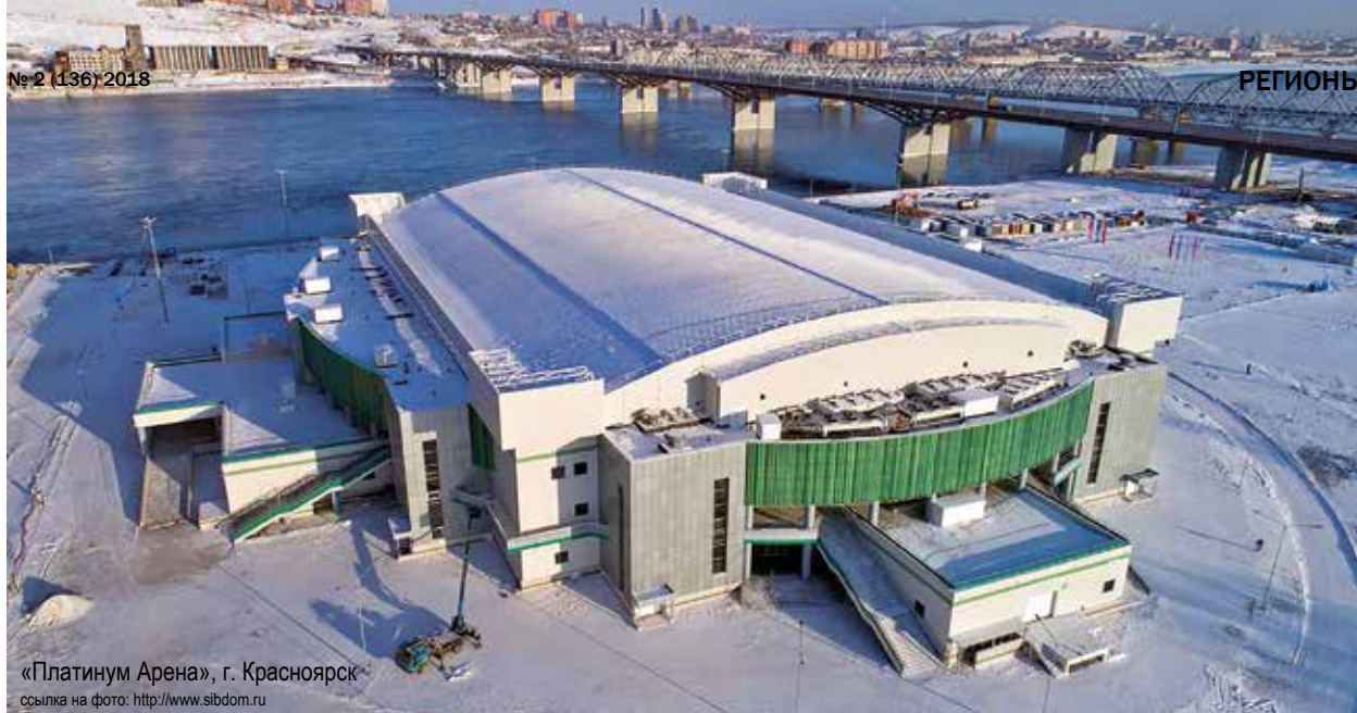
«Платинум Арена», г. Красноярск