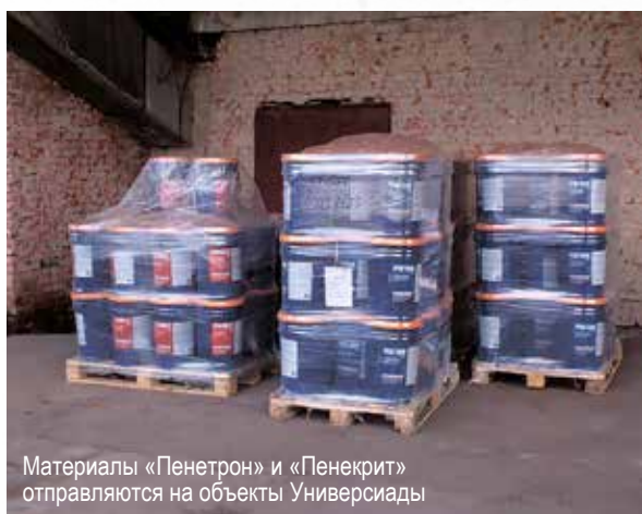
Материалы «Пенетрон» и «Пенекрит» отправляются на объекты Универсиады

но на Центральном стадионе планировали открывать и закрывать Универсиаду, однако от этой идеи отказались, чтобы гости не замерзли, наблюдая за церемонией под открытым небом «чаши»: все-таки Сибирь есть Сибирь, а соберутся студенты со всего мира.