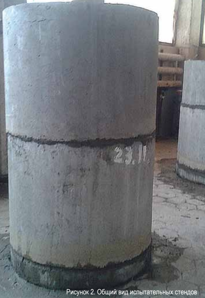
Рисунок 2. Общий вид испытательных стендов

боты в течение всего года (особенно в зимний период), руководством холдинга было принято решение о создании на производственной площадке Завода гидроизоляционных материалов Пенетрон испытательных стендов, максимально приближенных к условиям реальных объектов.