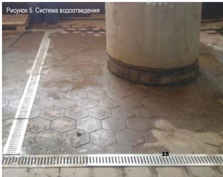
Рисунок 5. Система водоотведения

За счет использования бетонных колец, наполняемых водой, и системы водоотведения (рис.1, 5), можно применять гидроизоляционные материалы в режиме реального объекта (рис. 3-4), что, безусловно, повысит мастерство и профессионализм обучаемых. Еще один важный момент: испытательные стенды неоценимы при возникновении спорных ситуаций, связанных с качеством материалов, когда совместно с клиентом можно проверить качество материалов на практике. Таким образом, новый виток в развитии Учебного центра позволяет непрерывно проводить обучение представителей дилерских компаний в комфортных условиях, оценивать эффективность новых материалов перед запуском их в производство, а в результате – повысить удовлетворенность конечных потребителей ГК «Пенетрон-Россия».