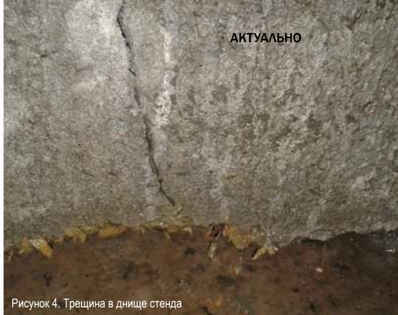
Рисунок 4. Трещина в днище стенда

вителей дилерских организаций в комфортных условиях даже зимой, что весьма актуально, учитывая особенности строительного сезона в России. Стенды смонтированы таким образом, что позволяют на практике закрепить навыки работы со всеми материалами системы Пенетрон без исключения (рис. 2).