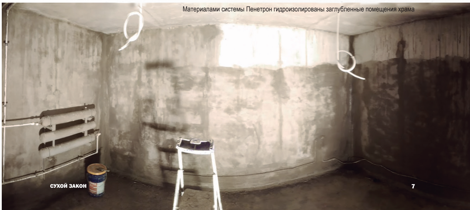
Материалами системы Пенетрон гидроизолированы заглубленные помещения храма

Для решения вопросов с гидроизоляцией застройщик обратился в представительство холдинга «Пенетрон-Россия» в Северо-Западном регионе – ООО «Пенетрон». Специалистами компании было произведено обследование строительных конструкций и составлена технологическая карта на производство работ. Специально для ИТР и рабочих на объекте проведено обучение с демонстрацией технологии, далее работы курировались на протяжении всего процесса, вплоть до завершения. Полностью была произведена гидроизоляция периметра, восстановлена герметичность стыков «стена-плита», отремонтированы трещины стен и пола, выполнены вводы коммуникаций. Материал «Пенетрон» замкнул контур и завершил гидроизоляцию храма. ❁