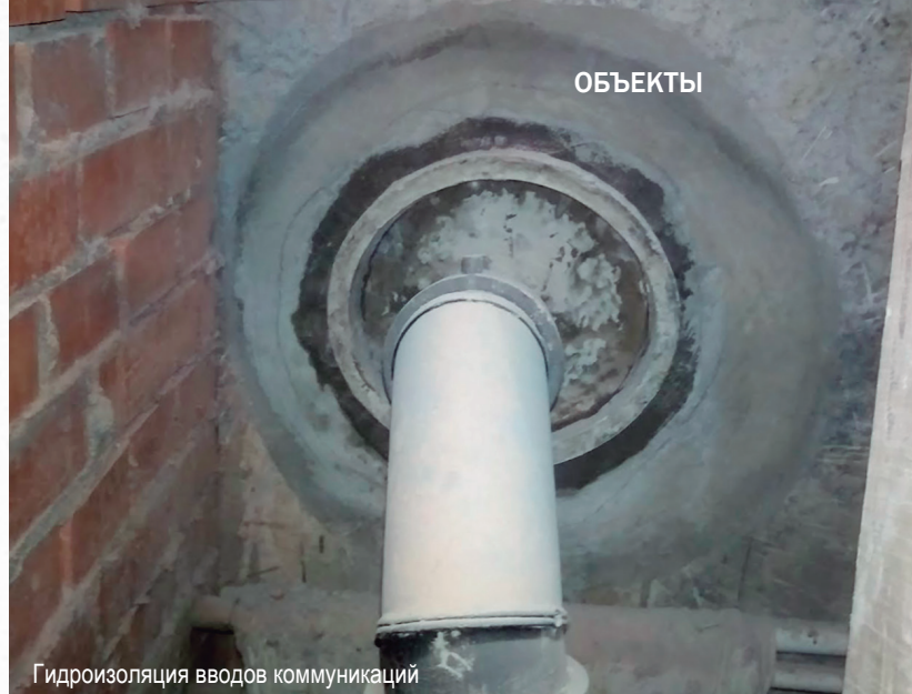
Гидроизоляция вводов коммуникаций

Когда, говоря словами Святого Писания, «исполнилась полнота времен» и пришло время строить храм в густонаселенном жилом массиве Санкт-Петербурга – на Гражданке, приход назвали в честь Тихвинской иконы Божией Матери. В небольшом деревянном храме стали совершаться регулярные богослужения. Приход объединил вокруг себя инициативных и неравнодушных людей. Была организована воскресная школа, наладили социальное и молодежное служение, для взрослых организовали еженедельный лекторий, а по воскресным дням во дворе храма стали устраивать чаепитие для прихожан и гостей прихода, даже начали издавать газету. Но само деревянное здание не могло вместить всех желающих участвовать в богослужении, не говоря уже о других мероприятиях. Чаения прихожан сбылись, и рядом