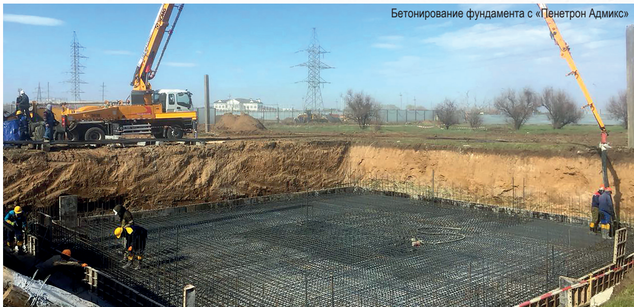
Бетонирование фундамента с «Пенетрон Адмикс»