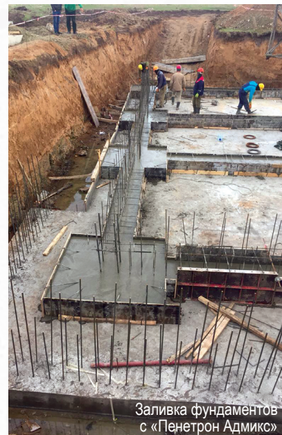
Заливка фундаментов с «Пенетрон Адмикс»

– по сути, высококлассные отели, а также 45 коттеджей для сотрудников дипломатических служб. Все работы по гидроизоляции доверены специалистам «Пенетрон-Казахстан». Работы по проекту ведутся с весны текущего года, и на данный период ход выполнения перевалил за 50 %. Для гидроизоляции подземной части зданий используется весь комплекс материалов системы Пенетрон. Это добавка в бетон «Пенетрон Адмикс», проникающий состав «Пенетрон», шовный материал «Пенекрит», гидроизоляционный жгут «Пенебар» и система Пенебанд С, а также «Скрепка М500 Ремонтная», однокомпонентный клей-герметик «Пенепокси 1К». Работы по гидроизоля-