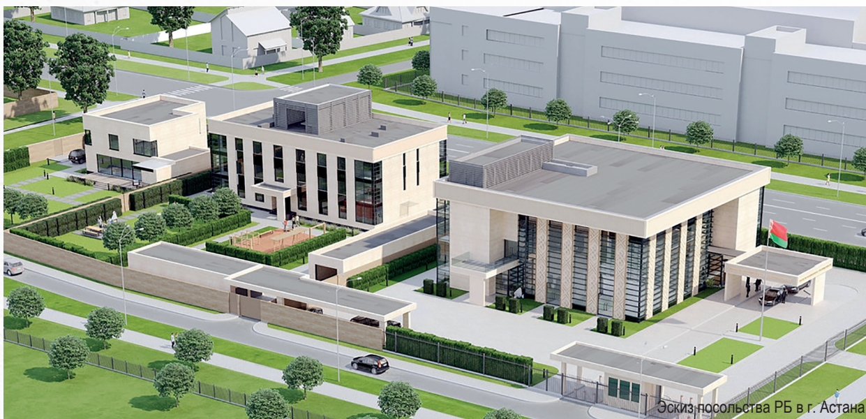
Эскиз посольства РБ в г. Астана

Есть на уровне посольств у компании «Пенетрон-Казахстан» еще один проект, территориально обособленный от дигородка, но все той же особой важности, точнее, в данном случае – асаблiвай важнасцi. Это новый комплекс дипломатического представительства Республики Беларусь. Белоруссия не столь близка к Казахстану в отношении границы, но зато ближайший партнер по Евразийскому экономическому союзу. Посольство Белоруссии в Казахстане работает уже 13 лет, и вот теперь для него строится новый комплекс зданий.