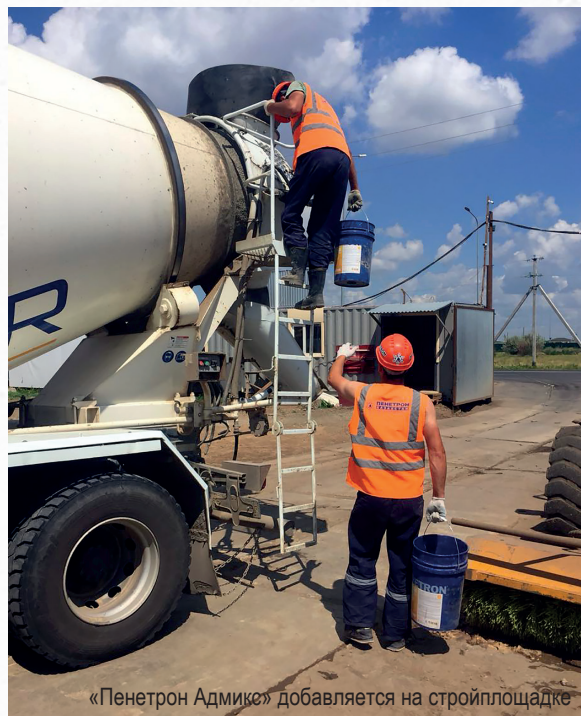
«Пенетрон Адмикс» добавляется на стройплощадке