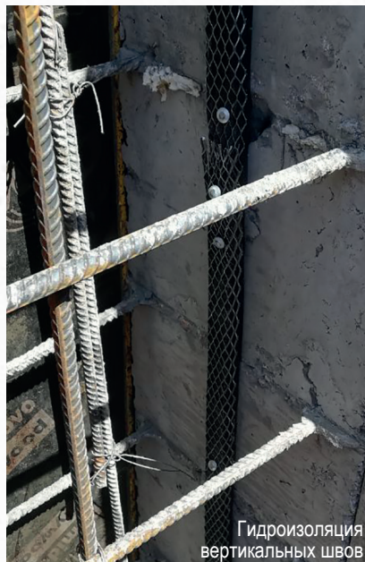
Гидроизоляция вертикальных швов