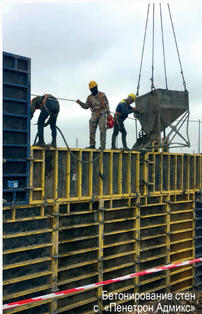
Бетонирование стен с «Пенетрон Адмикс»