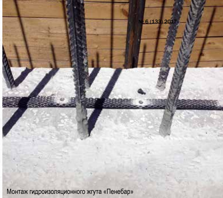
Монтаж гидроизоляционного жгута «Пенебар»

– Добавка «Пенетрон Адмикс» вводилась при заливке бетона практически всех ограждающих конструкций. После внесения в бетонную смесь добавки «Пенетрон Адмикс» никакой обмазочной либо оклеечной гидроизоляции уже не понадобилось. Тем самым генподрядчик сэкономил немалую сумму. Швы герметизировались гидроизоляционным жгутом «Пенебар», усадочные трещины – инъекционным материалом «ПенеПурФом 1К».