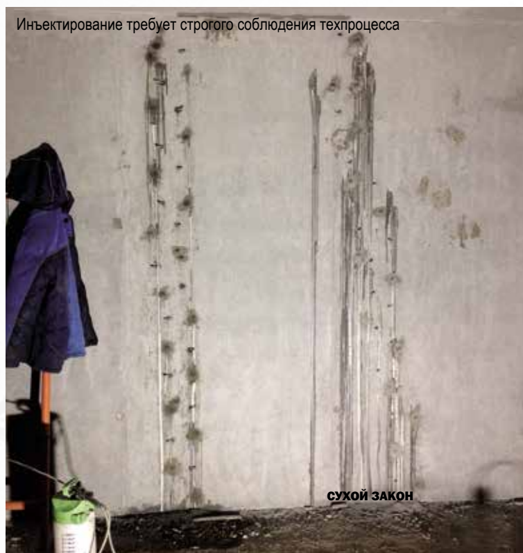
Инъектирование требует строгого соблюдения техпроцесса