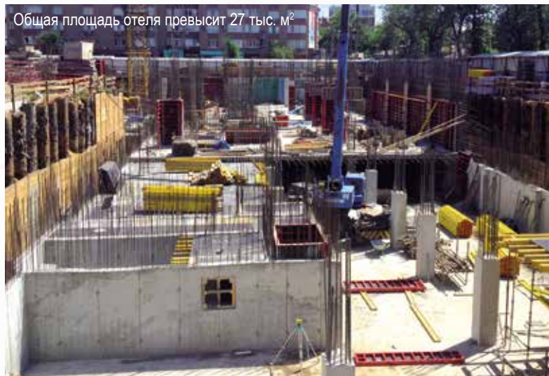
Общая площадь отеля превысит 27 тыс. м 2

загружать автомобилями центральные улицы исторического центра города.