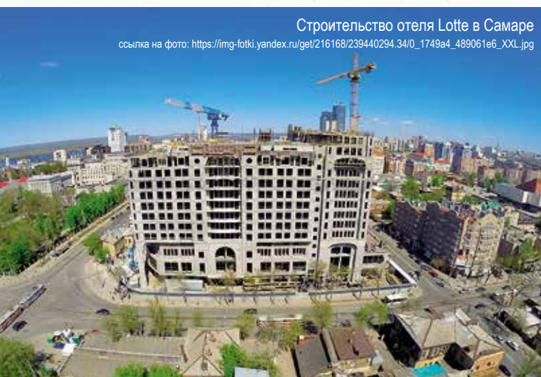
Строительство отеля Lotte в Самаре

К Чемпионату мира по футболу 2018 года в Самаре с нетерпением ждут открытия первого 5-звездочного отеля под южнокорейским брендом Lotte. Ввод намечен до конца 2017 года. Хотя общестроительных работ остается еще немало, бетонирование практически завершено. Основная часть гидроизоляционных работ на строительстве отеля проведена силами специалистов ООО «СПМУ-ПЕНЕТРОН», дилера холдинга «Пенетрон-Россия» в Самарской области, с применением, соответственно, материалов системы Пенетрон.