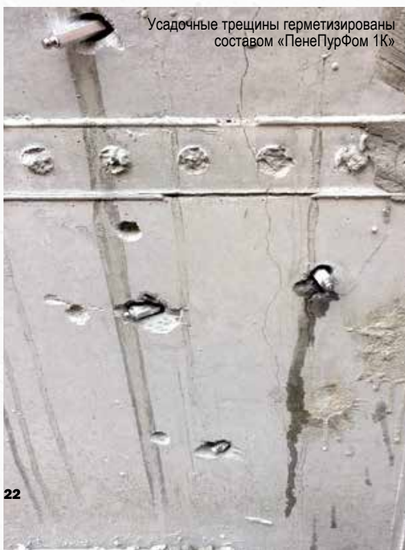
Усадочные трещины герметизированы составом «ПенеПурФом 1К»