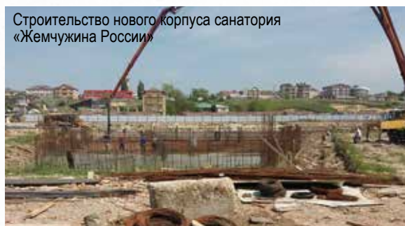
Строительство нового корпуса санатория «Жемчужина России»

Оздоровительный комплекс расширяется, при строительстве новых корпусов для гидро-