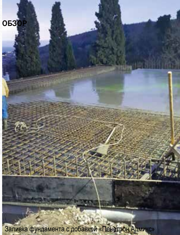
Заливка фундамента с добавкой «Пенетрон Адмикс»