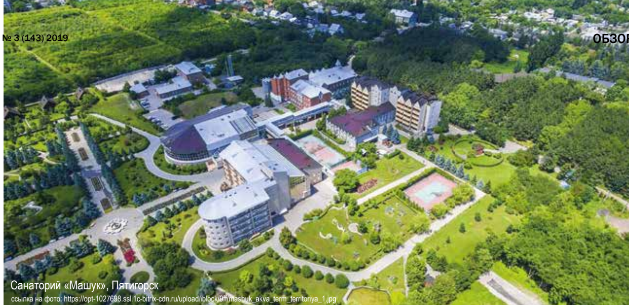
Санаторий «Машук», Пятигорск