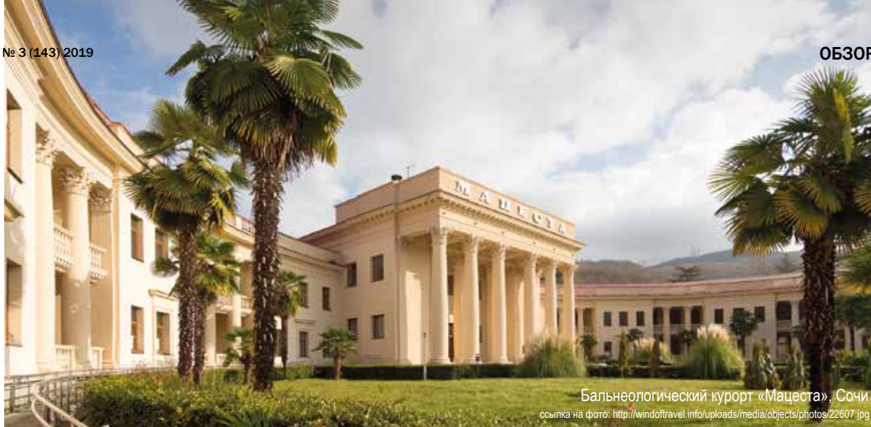
Бальнеологический курорт «Мацеста», Сочи

вый. Новый объект туристской инфраструктуры серьезно повышает привлекательность пос. Дивноморское, который входит в состав города-курорта Геленджик. Для гидроизоляции заглубленных железобетонных конструкций главного здания, фундаментов коттеджей, винного погреба, бассейна также применены технологии Пенетрон.