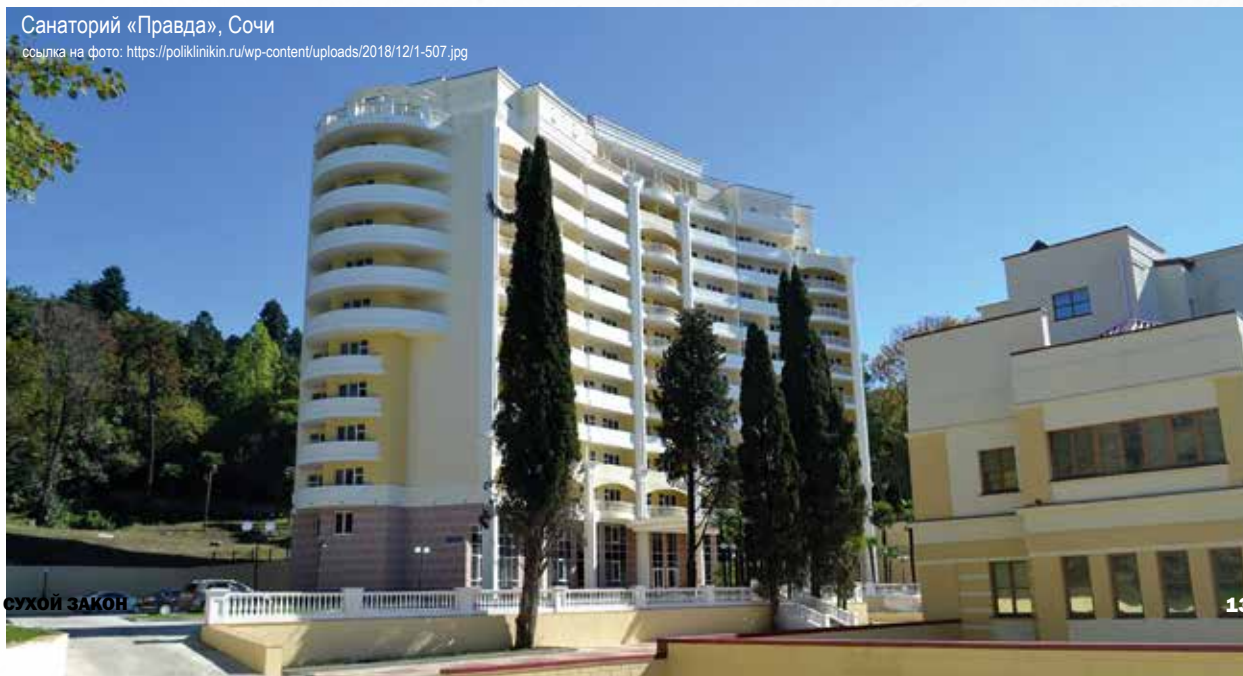
Санаторий «Правда», Сочи

Кстати, совсем недавно, в канун летнего наплыва отдыхающих, ООО «Пенетрон-Сочи» завершило серьезный проект в санатории «Правда». Это санаторий с большой, 80-летней, историей в красивейшей части города, между Курортным проспектом и берегом Черного моря с уникальным, одним из старейших в городе парков. Здесь с применением материалов системы Пенетрон гидроизолированы шесть лифтовых приемков.