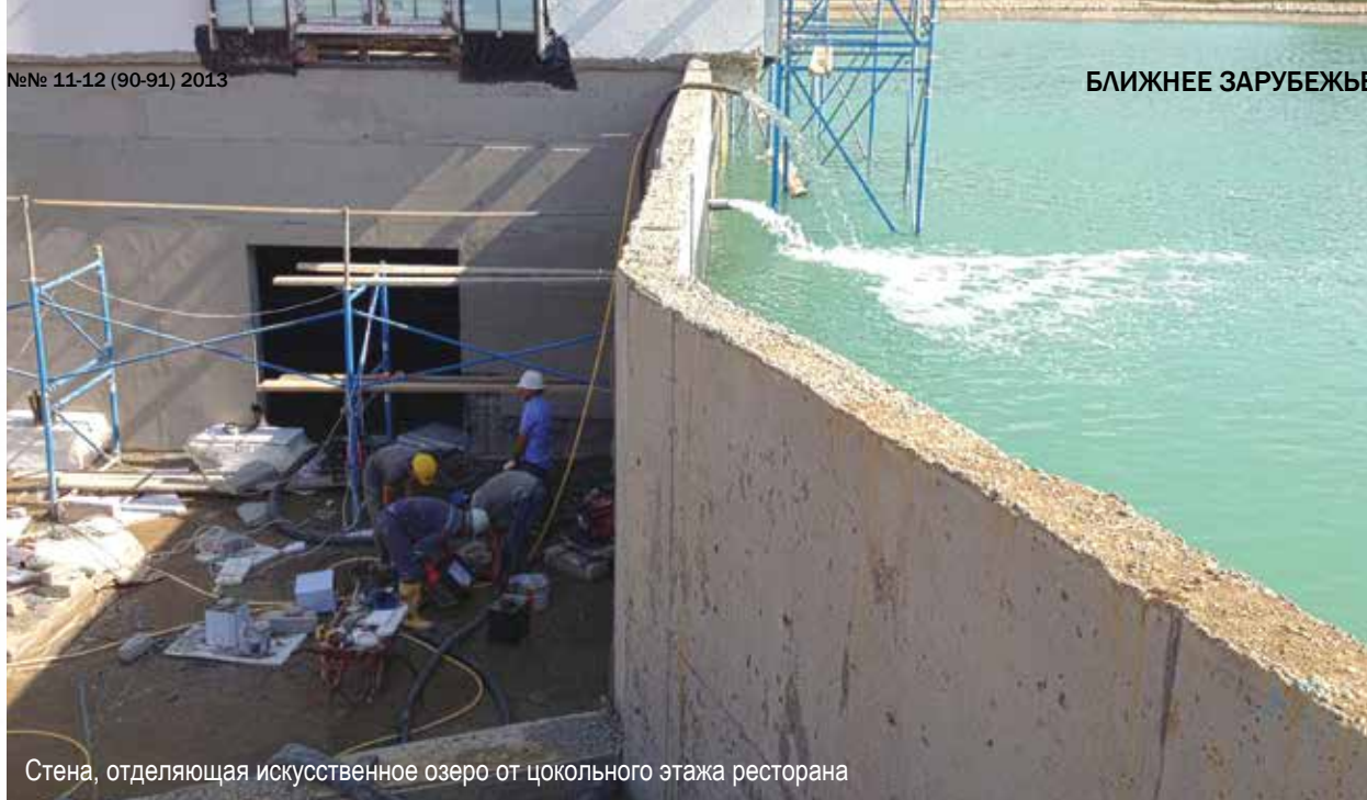
Стена, отделяющая искусственное озеро от цокольного этажа ресторана

водонепроницаемости всех бассейнов, которые расположились здесь.