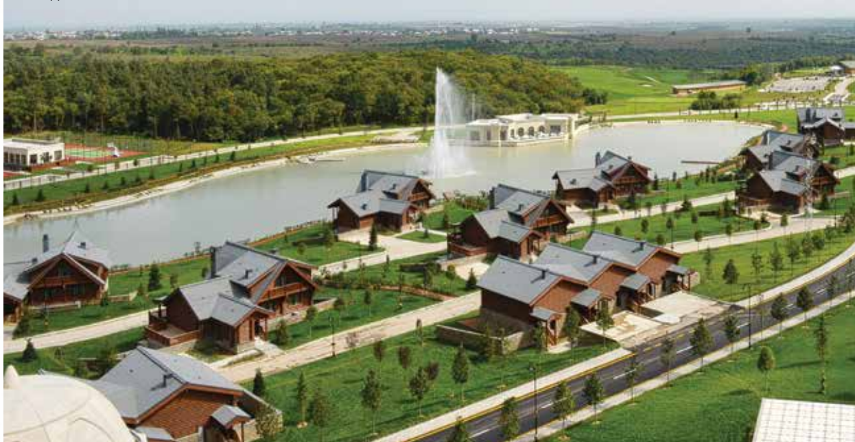
Коттеджная часть комплекса

В настоящее время в Азербайджане начинает работу роскошный отель сети Rixos Hotels & Resorts. С момента основания бренда в 2000 году пятизвездочные гостиницы «Rixos» открылись уже в нескольких странах бывшего Советского Союза. Они предлагают своим постояльцам рестораны с кухней разных стран мира, широчайший спектр SPA-процедур, ночные клубы и лаунж-бары, детские площадки, бассейны, игровые комнаты, водные горки и многое другое.