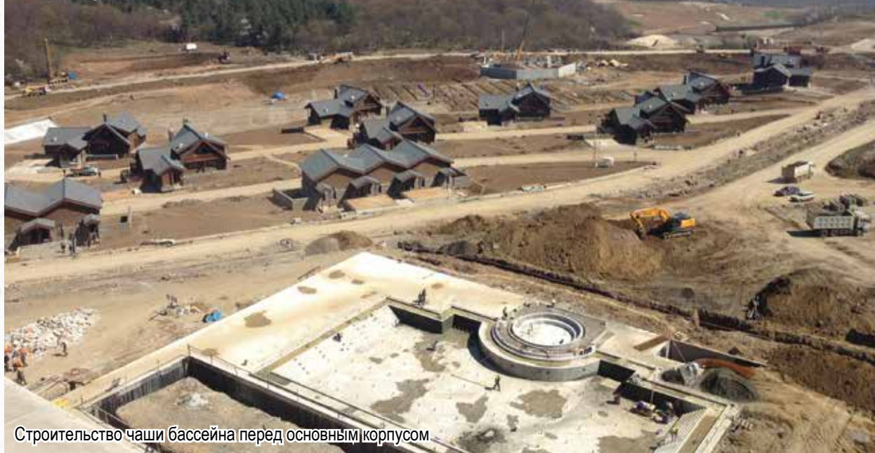
Строительство чаши бассейна перед основным корпусом

ных жителей работой обеспечит. Объект, безусловно, является знаковым, потому что его строительство держит на контроле сам президент республики Ильхам Алиев. Не так давно он осмотрел отель и все элементы инфраструктуры, ознакомился с применяемыми строительными и отделочными материалами, призвав вести все работы на самом высоком уровне.