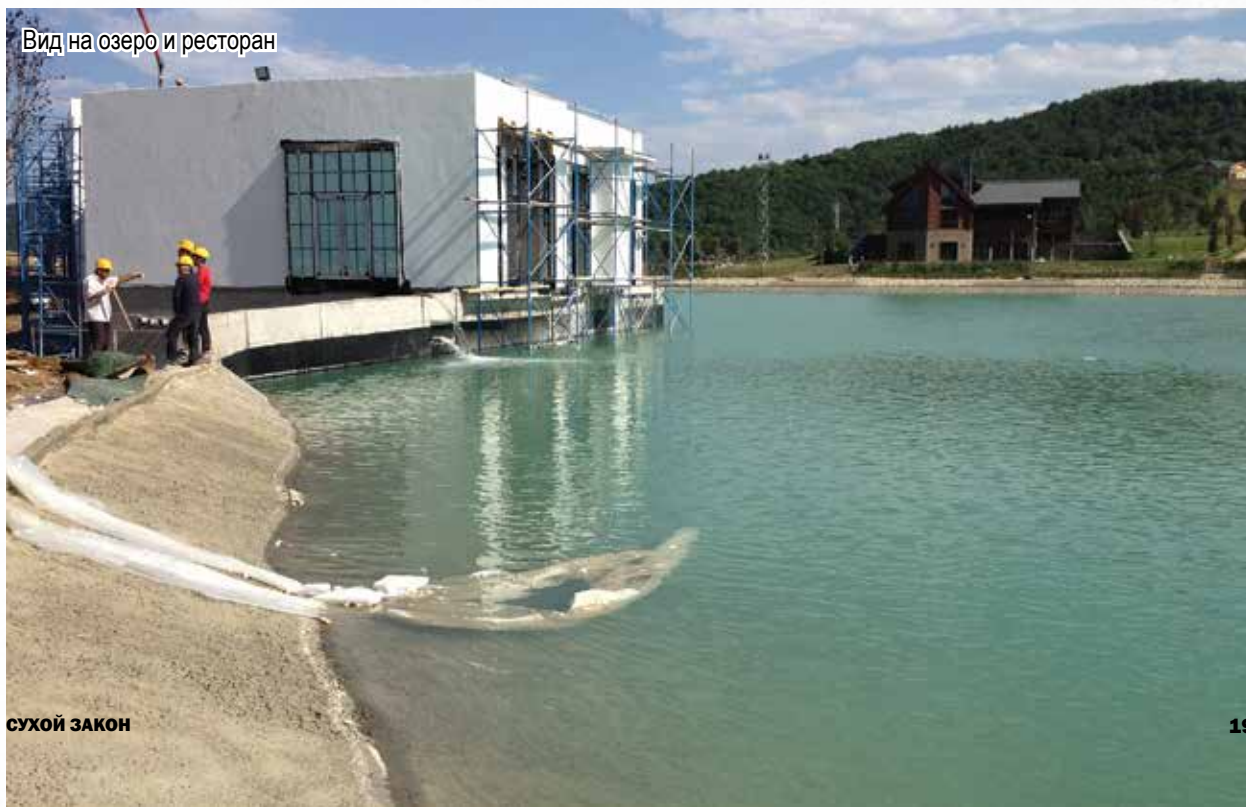
Вид на озеро и ресторан

Сейчас строительство отельного комплекса находится в стадии завершения. Его многочисленные объекты способны подарить море впечатлений и удовольствия всем своим гостям. С чувством законной гордости можно сказать – материалы системы Пенетрон имеют самое непосредственное отношение к тому, что азербайджанский «Rixos» – отель, соответствующий всем мировым стандартам качества.