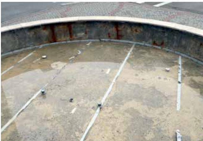
До начала работ