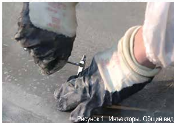
Рисунок 1. Инъекторы. Общий вид

Установить первый (крайний по горизонтали или нижний по вертикали) металлический инъектор.