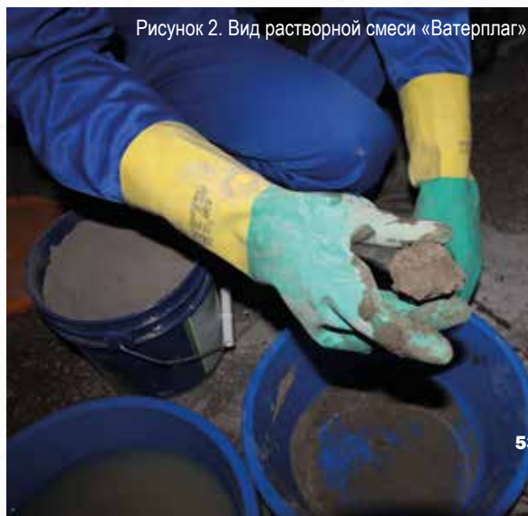
Рисунок 2. Вид растворной смеси «Ватерплаг»

После того как пробурены отверстия для инъектирования и напор воды в шве за счет этого будет снижен, заполнить полость шва «гидропломбами» «Ватерплаг» или «Пенеплаг» (рис. 2). В это время вода будет вытекать через пробуренные отверстия или инъекторы.