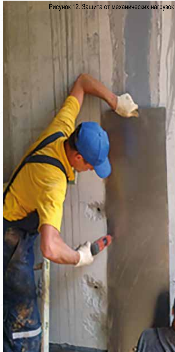
Рисунок 12. Защита от механических нагрузок

Если предполагается, что при эксплуатации лента будет подвергаться механическим воздействиям (например, движение транспорта, пешеходов или ударные нагрузки при отсыпке грунтом), то необходимо предусмотреть защиту ленты от механических нагрузок. Обычно для защиты целей используют дополнительную защиту с помощью транспортной ленты толщиной 5 – 10 мм в комплексе с оцинкованными металлическими листами или другие способы (рис. 12).