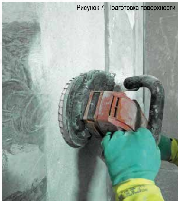
Рисунок 7. Подготовка поверхности

Неровные участки бетонной поверхности, препятствующие плотному прилеганию к ним гидроизоляционной ленты, должны быть восстановлены ремонтной смесью «Скрепа М500 Ремонтная», кромки шва должны быть округлены.