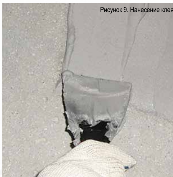
Рисунок 9. Нанесение клея

Клей нанести на подготовленную сухую бетонную поверхность непрерывным ровным слоем с помощью шпателя (рис. 9). Толщина слоя клея должна составлять 0,5 – 1,5 мм, а его ширина с каждой стороны шва должна быть 80 мм.