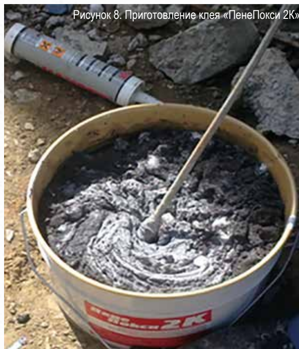
Рисунок 8. Приготовление клея «ПенеПокси 2К»

При использовании ленты «ПенеБанд С» применяется двухкомпонентный клей «ПенеПокси 2К». Смешать компоненты клея (А и В) в соотношении А: В = 2:1 по объёму в течение 3 минут до образования однородной массы (рис. 8). Для перемешивания использовать низкооборотную дрель (до 300 об/мин).