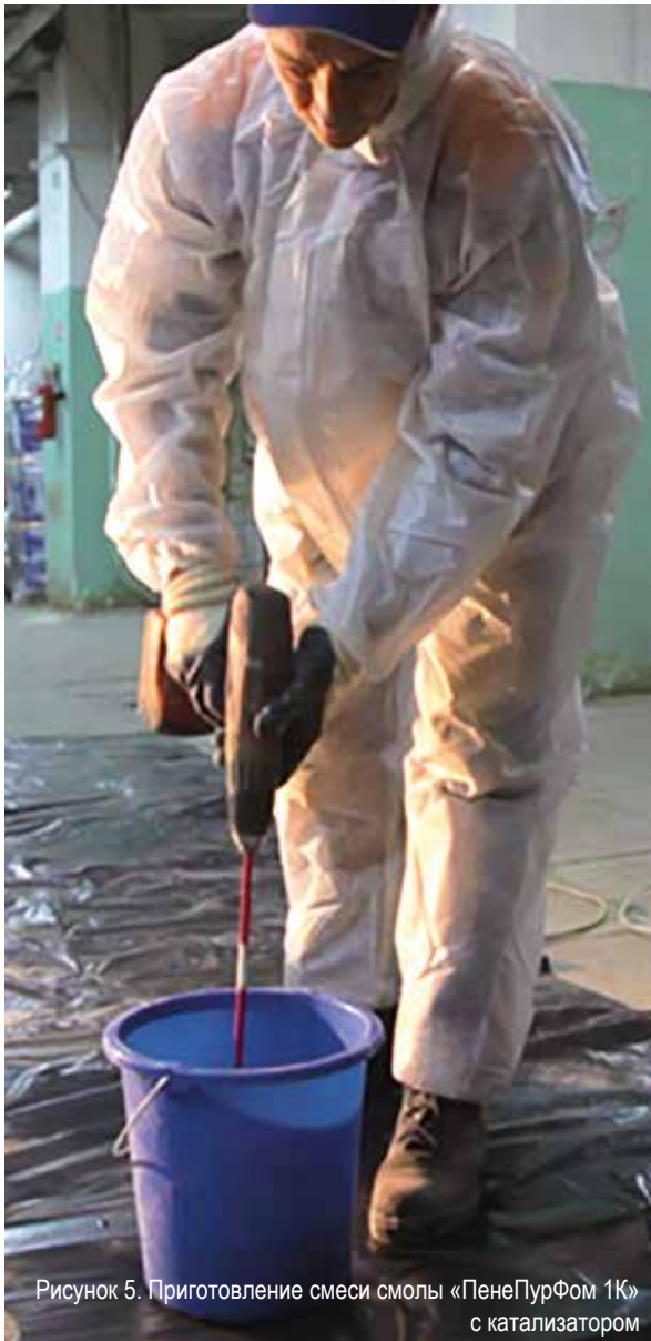
Рисунок 5. Приготовление смеси смолы «ПенеПурФом 1К» с катализатором

Необходимо готовить такое количество материала, которое можно израсходовать за время жизнеспособности.