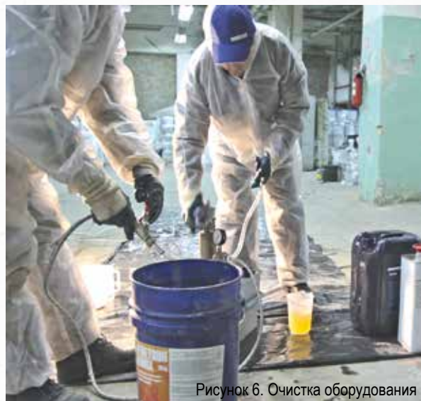
Рисунок 6. Очистка оборудования

После устранения активных течей следует приступить к монтажу ленты «ПенеБанд С».