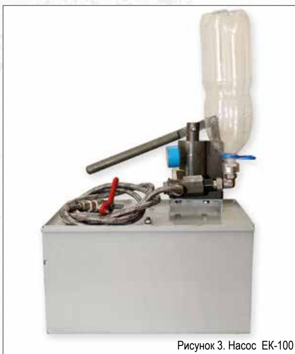
Рисунок 3. Насос ЕК-100