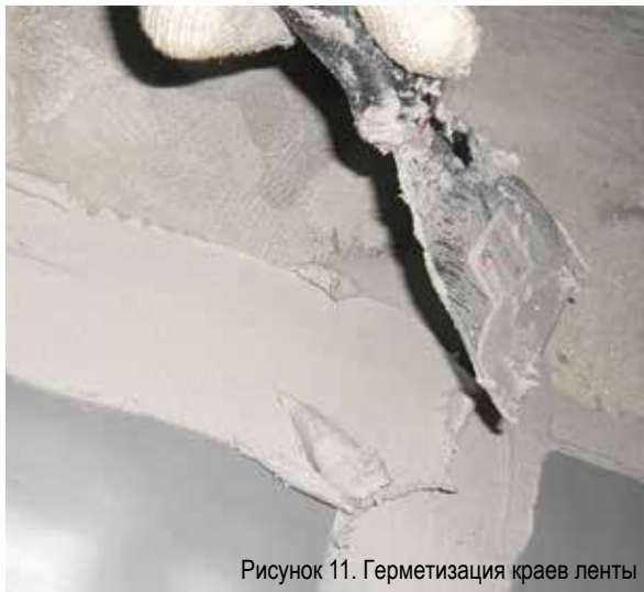
Рисунок 11. Герметизация краев ленты