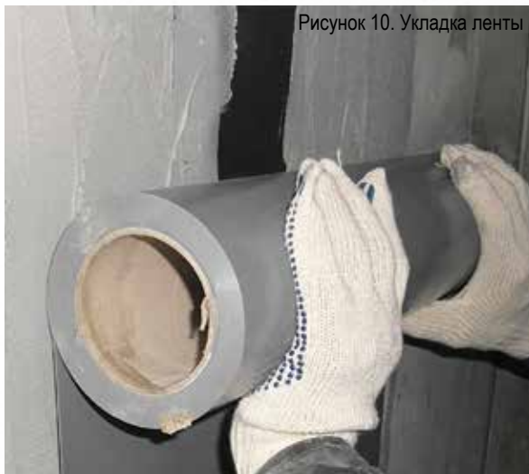
Рисунок 10. Укладка ленты