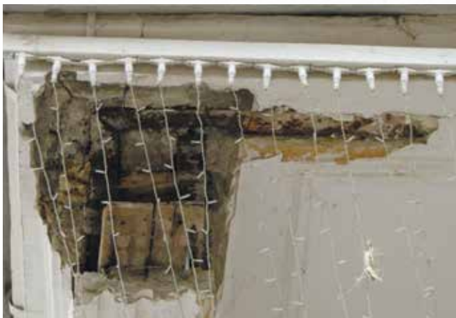
До начала работ