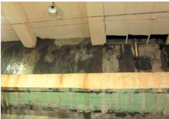
До начала работ